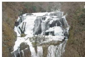
袋田の滝の氷瀑（大子町）

寒さが体に沁みる時期には、走行距離が短くても「袋田の滝」の氷瀑やイルミネーション、神社など見ごたえのあるスポットを堪能できるコースがあります！また、茨城は知られざる温泉の地でもありますので、凍てつく寒さの中、サイクリングを頑張った体を温泉で癒すのもオススメです。