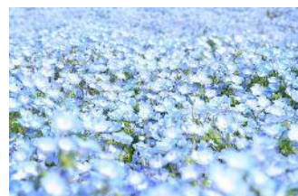
ネモフィラ（国営ひたち海浜公園）