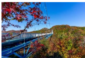
竜神大吊橋 （常陸太田市）

味覚の秋・スポーツの秋！まさにサイクリングの季節と言っても過言ではない秋には、サイクリングをしながら鮮やかに染まる紅葉や秋の味覚を満喫できます。茨城が誇る梨や栗、さつまいもや常陸秋そばなど、美味しいものがたくさんあり、一日では時間が足りないほど魅力が満載です。