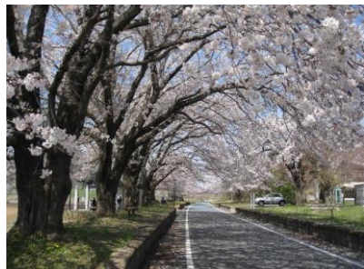
つくば霞ヶ浦りんりんロード雨引休憩所（桜川市）

県内には、桜の名所が点在しており、心地よい春の風をきって桜のトンネルを駆け抜けるサイクリングは爽快です。桜のトンネルは、つくば霞ヶ浦りんりんロードの土浦駅を出発し岩瀬駅へ至る筑波山側「旧筑波鉄道コース」で楽しめます。その他にも、チューリップや菜の花と一緒に桜を楽しめたり、桜並木や一本桜など、3月下旬～4月上旬にかけて桜の圧巻な景色を楽しむことができます。