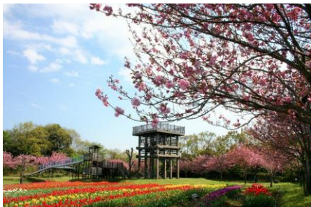
木原城山公園（美浦村）