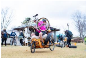
カーゴバイクレース

＜土浦レイクサイドバイクロア3開催概要＞ ※雨天決行、荒天中止 【日時】2023年3月18日（土）～19日（日）10：00～16：00 【場所】霞ヶ浦総合公園（土浦市大岩田145） 【入場料】無料（レースやイベントの参加は有料） 各イベント詳細についてはこちら ▶ https://bikelore.jp/tlb3/