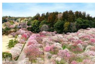
水戸の梅まつり（偕楽園）

3月19日（日）まで開催されている「水戸の梅まつり」や「筑波山梅まつり」では、現在梅が見頃を迎えております。さらに、4月中旬には国営ひたち海浜公園の「ネモフィラ」が、5月初旬には笠間市の「ツツジ」が見頃を迎えます。色鮮やかに染まるいばらきの春をお楽しみください。