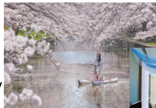
お花見水上サイクリング

BEB5土浦 ▶ https://hoshinoresorts.com/ja/hotels/beb5tsuchiura/