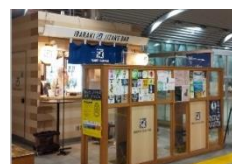
つくば店も引き続き営業中 つくばエクスプレス 「つくば駅」改札正面