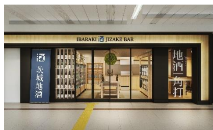
水戸店 ※完成イメージ JR「水戸駅」 みどりの窓口横

物販スペースには県内全酒蔵のお酒を取り揃えるため、気に入ったお酒があれば購入することも可能です。地酒が大好きな方はもちろん、初心者の方にも茨城の個性豊かな地酒を楽しんで頂けるスポットです。