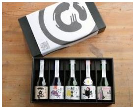
※写真はイメージです。

県アンテナショップ「IBARAKI sense」の店舗・オンラインショップにて、「いばらき地酒めぐり～飲み比べセット～」を販売いたします。県内25の酒蔵から25銘柄を取り揃え、水系やお酒の特徴により、300mlの小瓶を5本ずつにまとめた5セットです。関東屈指の酒どころ「茨城」の個性豊かな地酒の飲み比べはギフトに最適。また、ご自宅でもお楽しみいただけます。