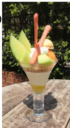
イバラキングのパフェ 1,980円(税込)

生産者が丹精込めて作った旬のフルーツを使ったパフェやケーキ。その季節にしか食べることのできない、素材の味を生かしたフレッシュなスイーツをお召し上がり頂けるカフェです。5月～6月は、産地から直送した茨城県オリジナル品種メロン「イバラキング」を贅沢に使用したパフェやケーキを販売。パフェはメロンのジュレ、ヨーグルトのパンナコッタ、新生姜のクリーム、自家製ジンジャーエールのジュレと、初夏を思わせるさわやかな構成にし、メロンのソルベと新生姜のアイスクリームを乗せました。