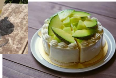
イバラキングメロンの ショートケーキ 1,080円(税込)