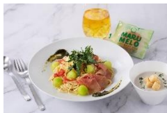
「イバラキング」冷製パスタ ¥2,000(税込)