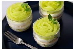
「イバラキング」のカップケーキ ¥400(税込)