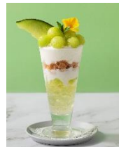
「イバラキング」のスペシャルパフェ ¥950(税込)

販売場所：茨城県アンテナショップ IBARAKI sense (東京都中央区銀座1-2-1)