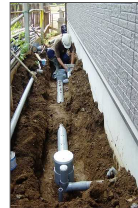
排水設備設置状況