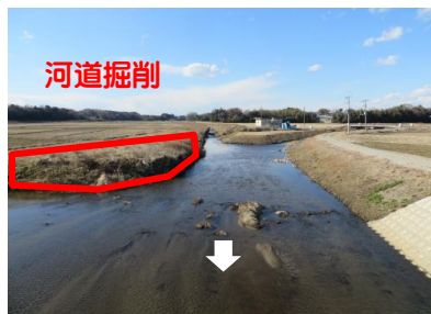
中丸川（ひたちなか市）