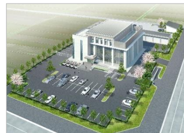
移転後のイメージ

3 移転後の太田警察署（予定） ・移転先 常陸太田市馬場町地内 ・建物の構造 鉄筋コンクリート造 3階 ・延床面積 約2,200㎡ ・敷地面積 約8,000㎡