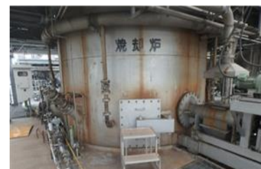
霞ヶ浦湖北流域下水道