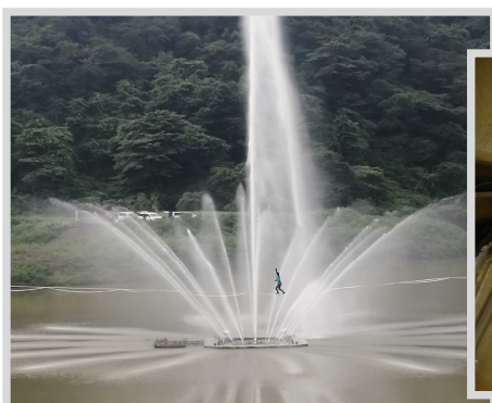
十王ダム噴水をバックに渡る 240m渡河中の挑戦者