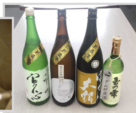
試飲用に十王ダム監査廊(通年14℃)に1年間貯蔵した、地元日立市の地酒4銘柄