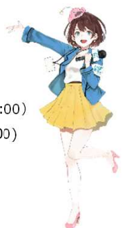
茨城県公認Vtuber 茨ひより