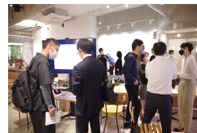
ネットワーキング