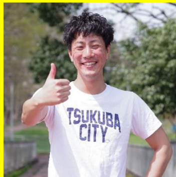
株式会社しびつくばわー 代表取締役社長