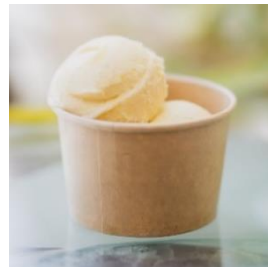
※画像はダブル ジェラートイメージ

「べにはるか」や「むらさき芋」など品種を複数ご用意しておりますので、この機会にぜひご賞味ください♪