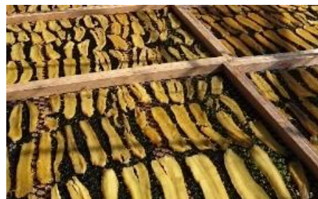
▼現地でのほしいも作りの様子

★2日（金）のみ、10:50～㈱クロサワファーム 黒澤社長による、ほしいも無料配布（50個限定）を実施します！