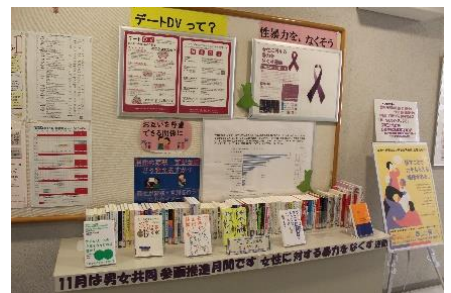
R4年度県立図書館でのパネル展・図書展