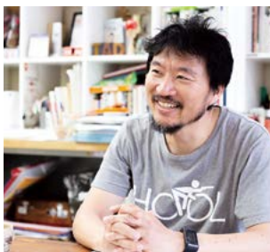
いばらきデザインセレクション2023 審査委員長