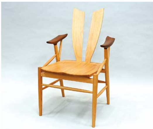
2014年 選定 Penna | 2021年 シリーズ選定 PA-11

〒312-0026 ひたちなか市勝田本町 2-35-702 Tel.029-272-5411 / 080-5520-7734 https://sites.google.com/view/gabounoa-hp