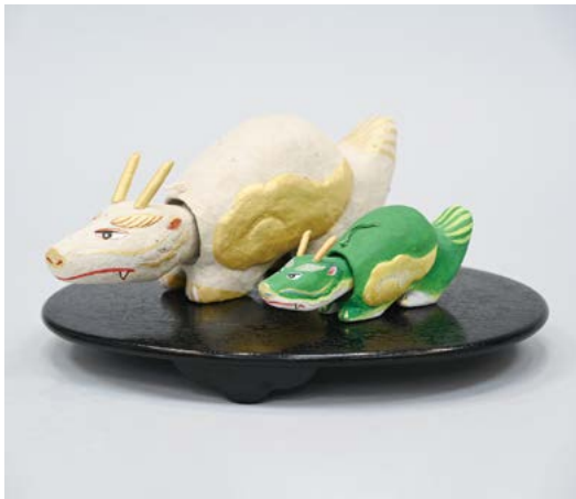
2022年 選定 那珂湊張り子