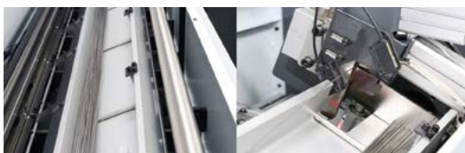
2009年 知事選定 自動棒材供給機バートップ OS20/32 | 2018年 シリーズ選定 高圧クーラント装置+自動棒材供給機バートップシリーズ 2020年 シリーズ選定 超極細棒材自動供給機バートップ OS4RE