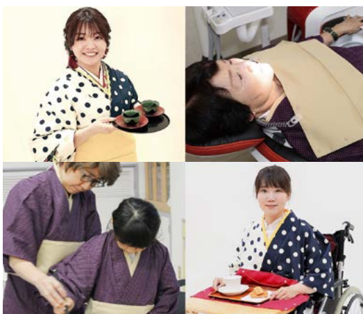
2015年 選定 車椅子用着用 (早咲羅)

〒300-4297 茨城県つくば市寺具 1395-1 Tel.029-869-1212 http://www.ikura.com/bartop-index.html