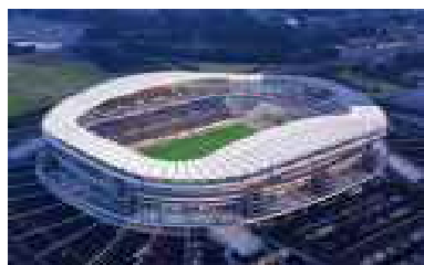
カシマサッカースタジアム

加えて、農林水産物の安定出荷が行われるとともに、6次産業化等やICT等の活用により、付加価値や生産性が高い農林水産業が進展しています。