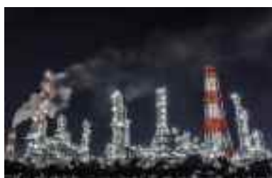
鹿島臨海工業地帯