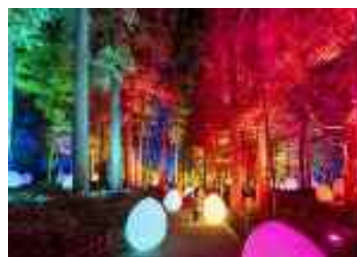
偕楽園とデジタルアート