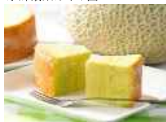
銚田メロンの6次産業化商品