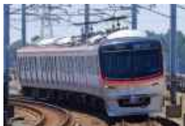
つくばエクスプレス