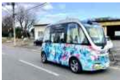
境町が運行する自動運転バス

さらに、広域交通ネットワークが充実し、自動車産業をはじめとした各種製造業の立地により、地域産業が活性化した一大産業拠点を形成しているとともに、伝統的な地場産業についても販路拡大が図られているなど新たな発展が図られております。