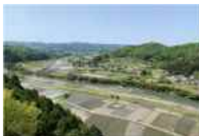
茨城県北ロングトレイルコースからの景色

さらに、臨海部においては、地域を牽引する事業者が成長するなど、地域産業の競争力等の強化により地域経済が活性化し、雇用が創出されるとともに、山間部においては、環境に配慮した有機農業等の取組や林業の成長産業化に加え、地域資源を活用した観光との連携が進み、付加価値の高い農林水産業が展開されています。