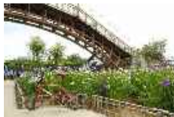
水郷潮来あやめ園