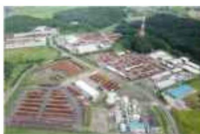
木材加工流通施設(宮の郷工業団地)