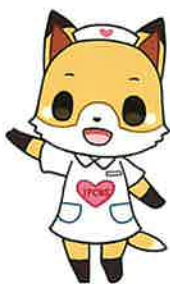
2年課程キャラクター フォニカ

准看護師学校で学んだ 知識・技術を基に、看護実 践力を積み上げられるよう、 教育を行っています。