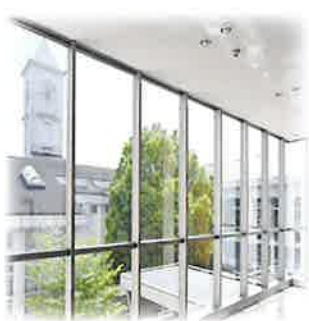
学校のシンボル時計台