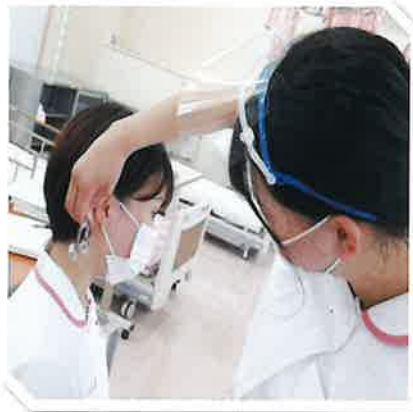
基礎看護学演習 (フィジカルアセスメント)