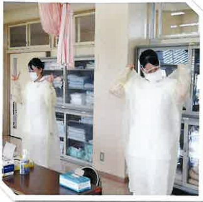
基礎看護学演習 (感染予防)