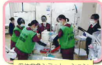
母体救急シミュレーション