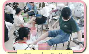
アロマテラピー・マッサージ