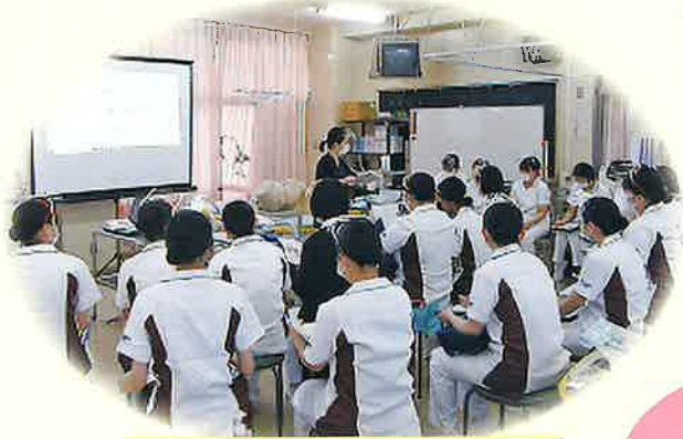
分娩期フィジカルイグザミネーション