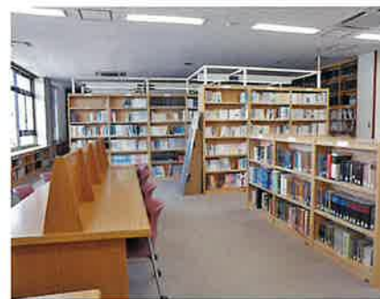
図書室：約 20000 冊