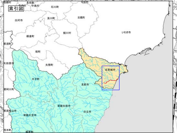
大北川水系大北川 洪水浸水想定区域図 (家屋倒壊等氾濫想定区域 (氾濫流))