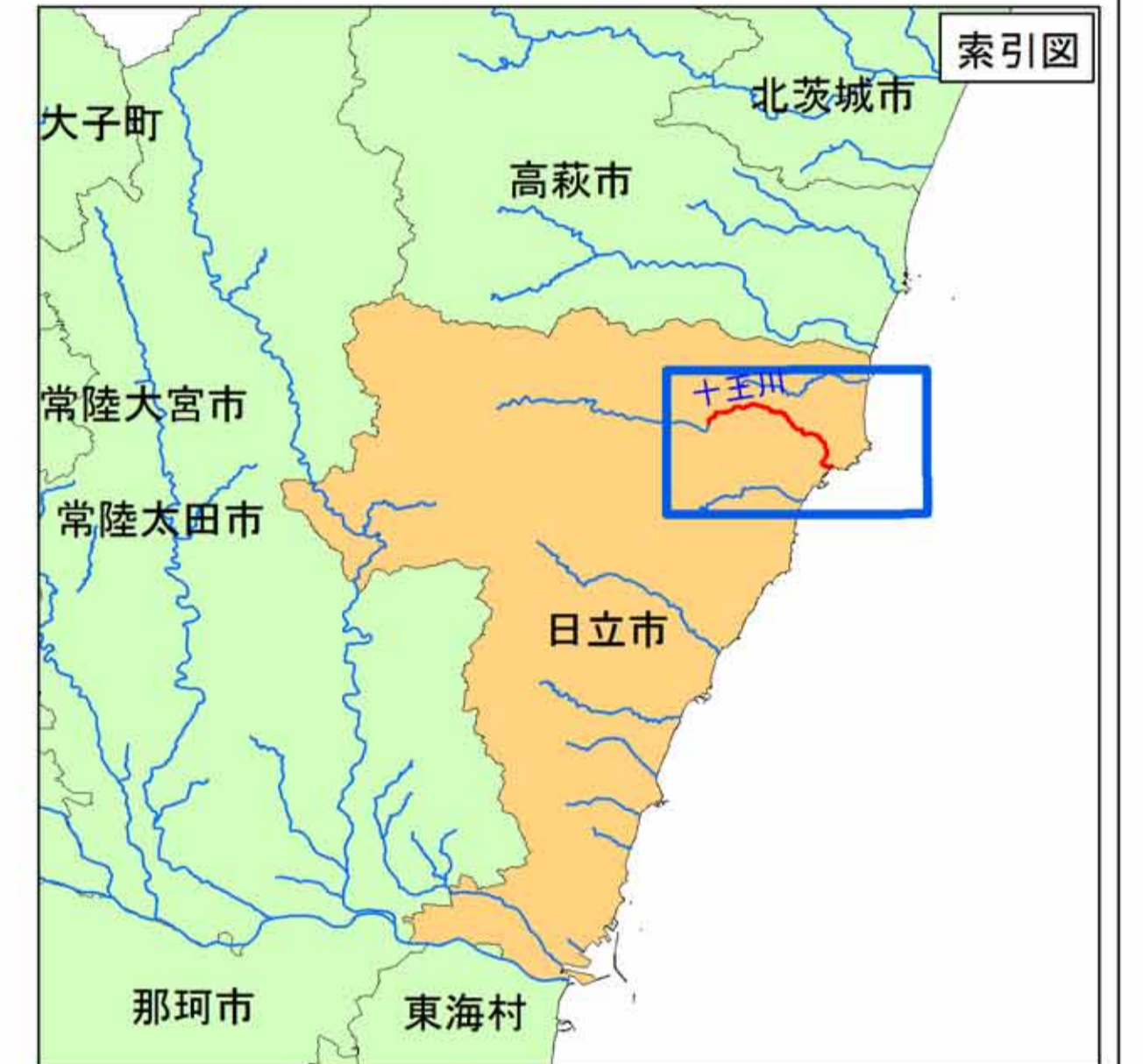
十王川水系十王川 洪水浸水想定区域図 (家屋倒壊等氾濫想定区域(河岸侵食))

1 説明文 (1) この図は、十王川水系十王川の水位周知区間について、家屋倒壊等をもたらすような氾濫の発生が想定される区域(家屋倒壊等氾濫想定区域)を表示した図面です。 (2) この家屋倒壊等氾濫想定区域は、現時点の十王川の河道及び洪水調節施設の整備状況を勘案して、護岸が崩壊した場合に想定最大規模降雨に伴う洪水により十王川の河岸の侵食幅を予測したものです。 (3) また、家屋倒壊等氾濫想定区域(河岸侵食)は、十王川の河岸が侵食された場合における、家屋の倒壊・流出等の危険性がある区域の目安を示すものですが、個々の家屋の構造・強度特性等の違いから、この区域の境界は厳密ではなく、あくまでも目安であることに留意して下さい。 2 基本事項等 (1) 作成主体 茨城県 (2) 公表年月日 平成29年8月28日 (3) 対象となる水位周知河川 十王川水系十王川(実施区間) 左岸：日立市十王町友部 1796(常磐自動車道)から河口まで 右岸：日立市十王町友部 1293-6(常磐自動車道)から河口まで (4) 算出の前提となる降雨 十王川流域の24時間の総雨量 681.9mm (5) 関係市 日立市