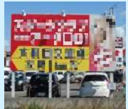
基準以上に鮮やかな色を使用している野立看板