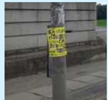
広告物の掲出が禁止されている電柱に貼り付けられているはり紙