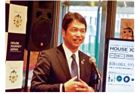
オープニングトークショーでは、本県の食の魅力を熱く語らせていただきました