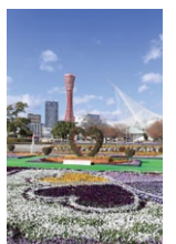
神戸メリケンパーク▶

今月、開港10周年を迎える茨城空港では、昨年8月より神戸便が増便され、朝昼夜の1日3往復運航しています。港町である神戸は、西洋文化がいち早く取り入れられた街であり、異国情緒あふれる景観が楽しめます。また、神戸空港から大阪まで40分、京都まで70分と関西圏へのアクセスも良好です。ますます便利になった茨城空港を、観光にビジネスにぜひご利用ください。