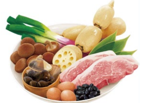
今回のフェアで使用される「茨城」の上質で豊かな食材