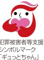
犯罪被害者等支援 シンボルマーク 「ギョッとちゃん」

毎年11月25日から12月1日は「犯罪被害者週間」です。犯罪被害は、いつ、どこで、誰に起こるか分かりません。被害に遭われた方やご家族の回復には、周囲の理解と温かな支援が必要です。一人一人が被害者に寄り添う心を持ち、支援の輪を広げましょう。