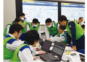
県内で大規模な土砂災害が発生したとの想定で、職員を対象とした防災訓練を行いました(2月13日)