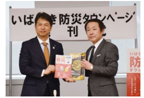
県庁でいばらき防災タウンページの発刊式を行いました(2月7日)