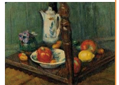
中村 彝「静物」1919年 当館蔵

展示室1では、横山大観や中村彝のほか茨城ゆかりの作家を中心に、冬から春へと移りゆく季節を感じさせる作品を、展示室2では、笠間市出身の日本画家・木村武山の彩色杉戸絵23枚を紹介します。